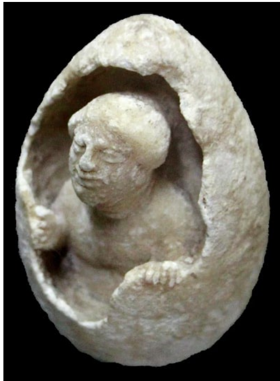
Ένα γλυπτό που δείχνει την γέννηση της Ελένης της Τροίας. Ασβεστόλιθος, έκανε τον 5ο αιώνα Π. χ. (Αρχαιολογικό Μουσείο Μεταπόντιο, Ιταλία).

Η ασυνήθιστη ιστορία και μυθολογική ιστορία προσθέσει σίγουρα σημαντικό βάθος της Ελένης χαρακτήρα, που τα ξεχωρίζει από όλους τους άλλους θνητούς.