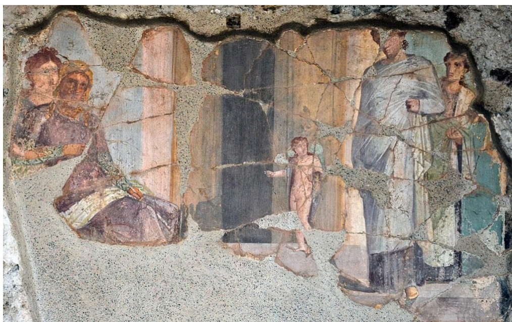
Античная фреска в Помпеях, Дом Золотых Купидонов, изображающая встречу Париса и Елены.

Зевс последовал его примеру и превратился в лебедя, после чего они спарились и отложили яйцо, которое было отдано Леде.