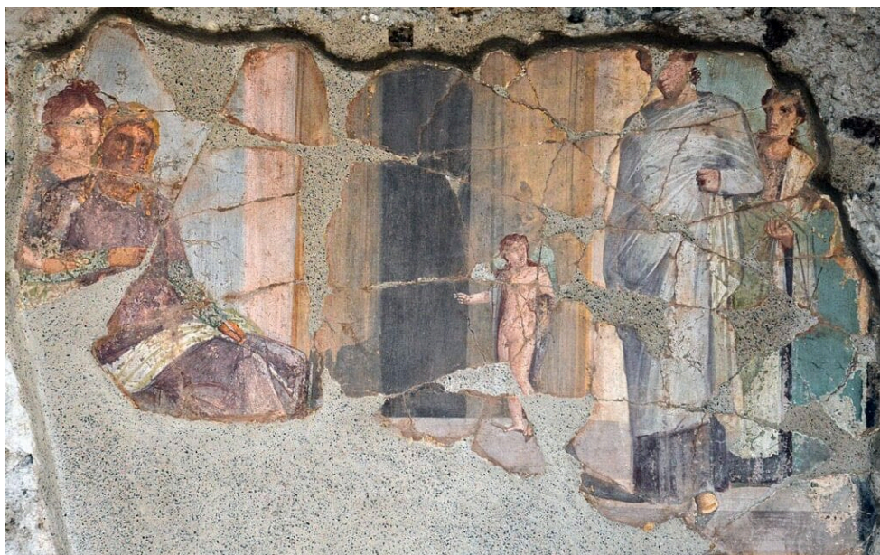
Παλαιά τοιχογραφία στην Πομπηία, το Σπίτι του το Golden Cupids που απεικονίζει μια συνάντηση μεταξύ του πάρη και της Ελένης.

Ο δίας ακολούθησαν, όπως ένα κύκνο, με αποτέλεσμα τη σύζευξη και την επακόλουθη τοποθέτηση των αυγών που δόθηκε Λήδα.