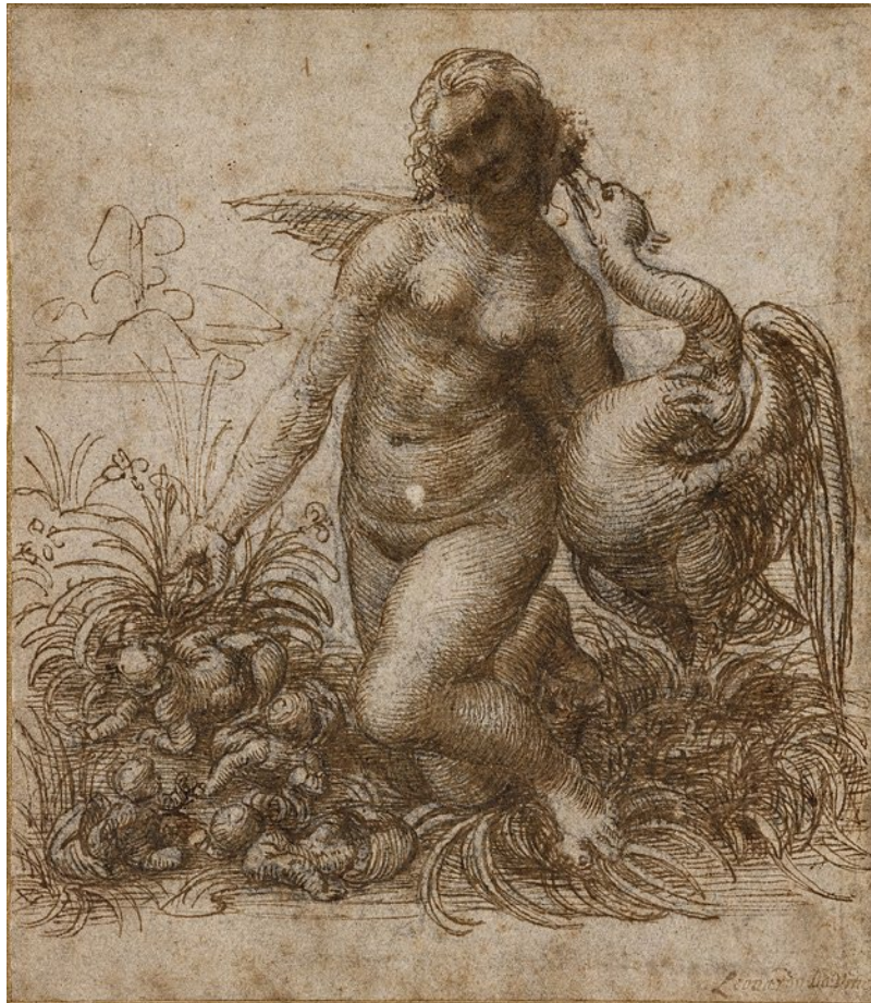
Η λήδα και ο Κύκνος, σχέδιο σε χαρτί, το Chatsworth. Πίστωση: Leonardo da Vinci, drawingsofleonardo.org, Wikimedia Commons, Public Domain

Καλλιτέχνες όπως ο Λεονάρντο ντα Βίντσι προσπάθησε να απεικονίζουν την ομορφιά αυτού του μύθου. Leonardo da Vinci δημιούργησε δύο κομμάτια για Λήδα και ο Κύκνος, ενδεχομένως, μεταξύ 1503 και 1510.